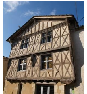
Sauveterre de Guyenne