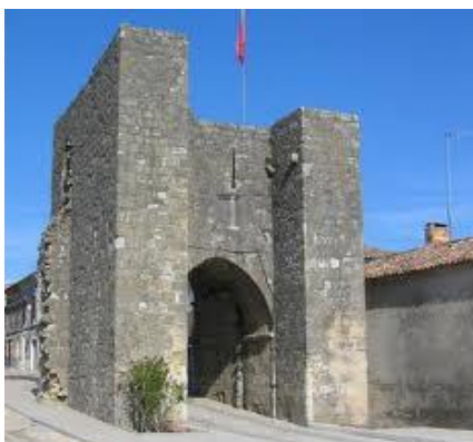
Sauveterre de Guyenne