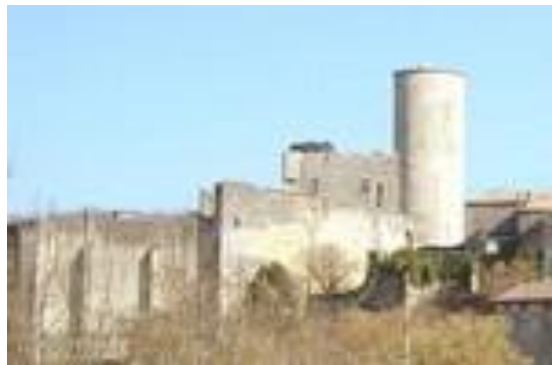
Château de Rauzan