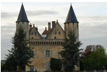
Château du Grand Puch