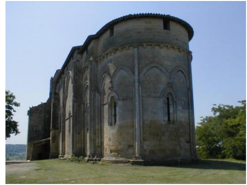
Eglise de Pujols