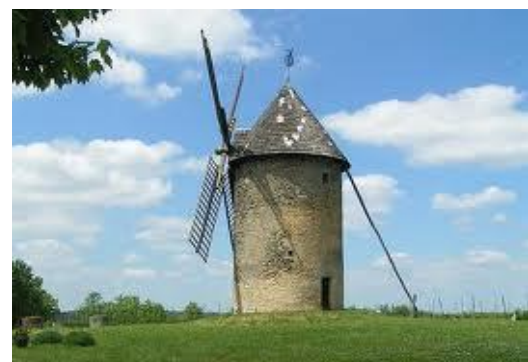
Moulin de Gornac