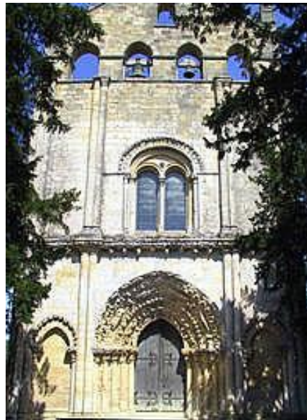
Abbaye de Blasimon