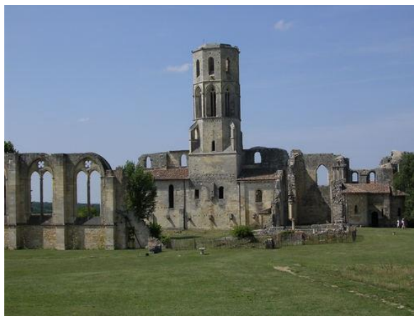
Abbaye de la Sauve Majeure