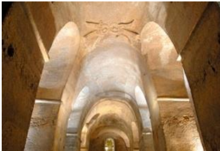
Eglise monolithe souterraine