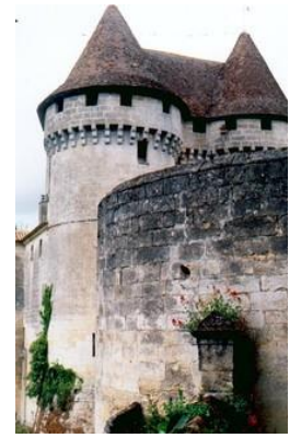
Fuie et donjon du Château de Pressac