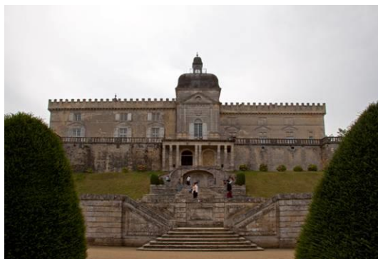
Château de Vayres